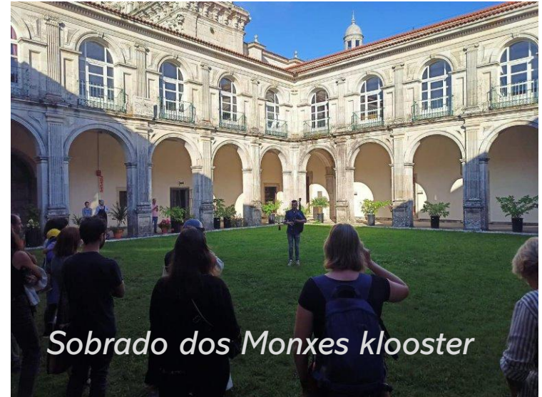
Sobrado dos Monxes klooster