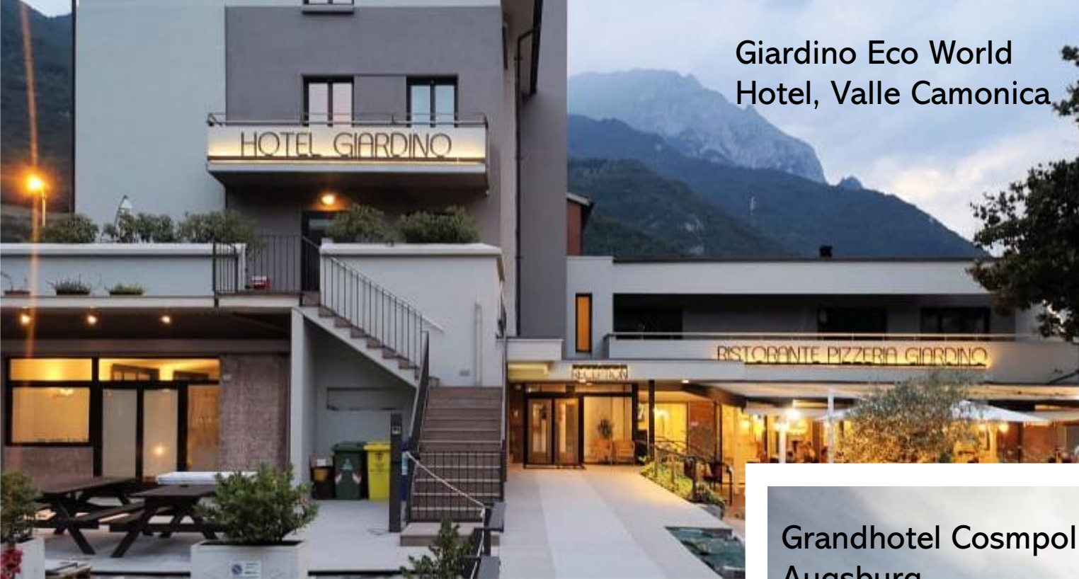
Giardino Eco World Hotel, Valle Camonica