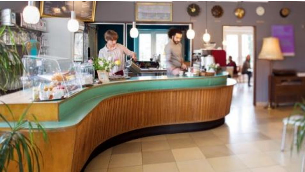
Grandhotel Cosmpolis Augsburg